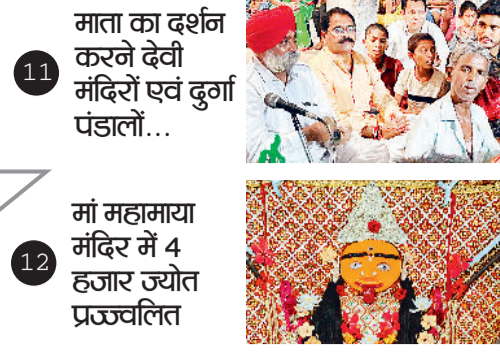
11 माता का दर्शन करने देवी मंदिरों एवं दुर्गा पंडालों...