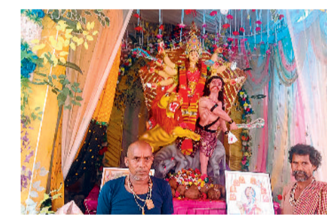
कुंआ चौक बाबुड़