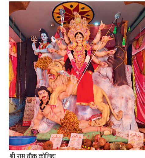
श्री राम चौक कोलिहा