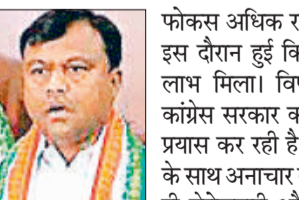
फोकस अधिक रहा। ऐसी घटनाएं भी इस दौरान हुई कि कांग्रेस को इसका लाभ मिला। विपक्ष की भूमिका में कांग्रेस सरकार का लगातार घेरने का प्रयास कर रही है। यहां पर महिलाओं के साथ अनाचार की घटनाओं के साथ ही बेरोजगारी और अन्य मामलों को लेकर लगातार सवाल उठाए जा रहे हैं। अब सरकार के एक साल के कार्यकाल की समीक्षा के बाद कांग्रेस अपनी रणनीति को मूर्त रूप देगी। आम जनता से पार्टी के जुड़ाव को ध्यान में रखते हुए न्याय यात्रा की जाएगी। कांग्रेस अध्यक्ष दीपक बैज ने साफ कहा है कि कांग्रेस की न्याय यात्रा का समापन नहीं हुआ है, बल्कि अभी विराम लगा है। आगे भी ये यात्रा प्रदेश की दूसरी जगहों पर जारी रहेगी। पार्टी जनता से जुड़े मामलों को सड़क की लड़ाई के माध्यम से जनता तक पहुंचाने के प्रयास में है।

छत्तीसगढ़ में बलौदाबाजार आगजनी कांड, कवर्धा के लोहारीडीह मामले और कानून व्यवस्था की स्थिति को लेकर 125 किमी न्याय यात्रा की सफलता के बाद कांग्रेस कमटी अब दूसरी जगहों से ऐसी यात्रा शुरू करने के संबंध में रणनीति तैयार कर रही है। कांग्रेस का फोकस ऐसी जगहों पर होगा, जहां कांग्रेस पिछड़ गई है। वहां पर ऐसे युवा, जिन पर सरकार को घेरा जा सके, इसकी पूरी जानकारी जुटाने के बाद आने वाले दिनों में बस्तर, सरगुजा और अन्य संभागों से ऐसी यात्रा शुरू की जाएगी। फिलहाल अभी निकाय और पंचायत चुनाव पर पार्टी का फोकस रहेगा। छत्तीसगढ़ में भाजपा सरकार आने के बाद कानून व्यवस्था की स्थिति पर कांग्रेस का