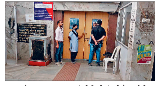
प्रस्ताव भेजा गया था, मगर वहां भी निजी कंपनी के गार्ड ही सुरक्षा का काम संभाल रहे हैं।

मामला गरमने के बाद अस्पताल और कॉलेज प्रबंधन ने सुरक्षा संसाधनों को अपडेट करने की जरूरत बताई थी। इसे ध्यान में रखते हुए स्वास्थ्य विभाग द्वारा 12-12 बंदूकधारी जवानों की इयूटी लगाने पर सहमति जताई गई थी। अस्पताल प्रबंधन से पुलिस विभाग को पत्र भेजने कहा गया था, जिसकी प्रक्रिया पूरी हुई, मगर समय बीतने के बाद मामला ठंडे बस्ते में चला गया। आंबेडकर अस्पताल में सुरक्षा के साथ अन्य कार्यों की जिम्मेदारी अभी भी निजी एजेंसी द्वारा उपलब्ध कराए जाने वाले सुरक्षा गार्डों के भरोसे है। अस्पताल के संवेदनशील इलाकों में इयूटी करने के बजाय इनका ज्यादातर उपयोग गेट और ओपीडी में हो रहा है। अस्पतालों में सुरक्षा के लिहाज से सीसीटीवी कैमरों की संख्या बढ़ाने की योजना भी थी, मगर इस पर भी काम शुरू नहीं हो पाया है। डीके अस्पताल में भी सशस्त्र बल की तैनाती के लिए