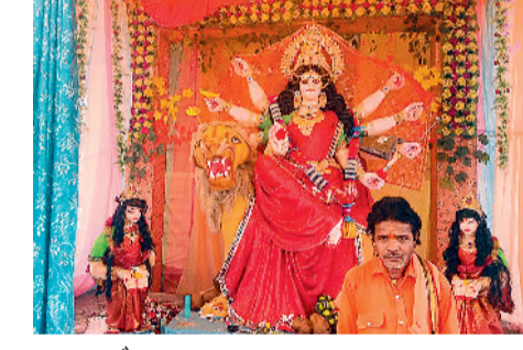
महामाया चौक बगबुड़ा

मुंडा। शारदीय नवरात्रि पर्व पर इन दिनों अंचल के ग्राम मुंडा, कोलिहा, सरवाडीह, जुड़ा, पैजनी, कोहरोद, कुम्हारी, धाराशिव मल्लौन, बिटकुली, धनगांव, बरदा, जामडीह, विंदोला, पंडरिया, सरखोर, अहिलदा सहित आसपास के क्षेत्र में नवरात्रि पर्व के चलते अंचल में भक्ति की लहर है। मां दुर्गा की आराधना में भक्तों की भीड़ ह्राकियों में देखने को मिल रही है। मुंडा के महामाया मंदिर में दर्शन करने भक्तजन पहुंच रहे हैं। लवन नगर में करीब 20 जगहों पर दुर्गा माता की प्रतिमा स्थापित की गई है। दुर्गा उत्सव के संस्कार नवरात्रि के पावन पर्व पर भक्ति में डूबे हुए हैं। लवन के प्रसिद्ध मां महामाया मंदिर में सुबह से शाम तक हजारों श्रद्धालुगण दर्शन करने पहुंच रहे हैं।