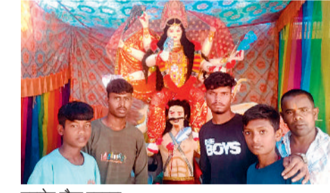
महादेव चौक बगबुड़ा