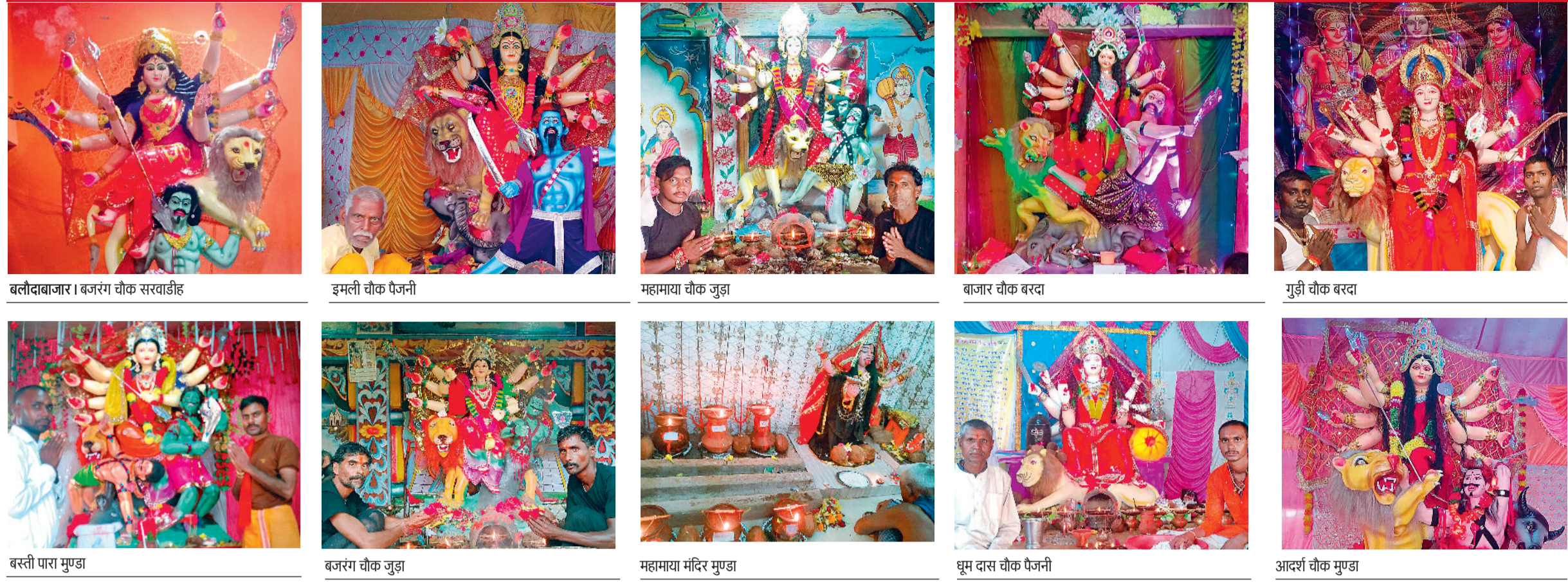
बलौदाबाजार | बजरंग चौक सरवाडीह इमली चौक पैजनी महामाया चौक जुड़ा बाजार चौक बरदा गुड़ी चौक बरदा बस्ती पारा मुण्डा बजरंग चौक जुड़ा महामाया मंदिर मुण्डा धूम दास चौक पैजनी आदर्श चौक मुण्डा